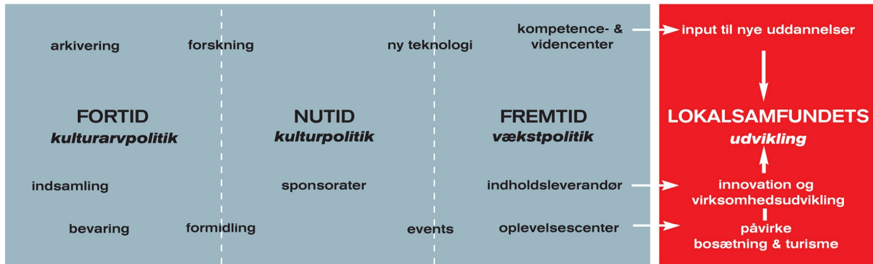
Institution og attraktion - udviklingsmodel

Institutioner rummer både fortid, nutid og fremtid. De nye roller som kompetencecenter og indholdsleverandør åbner nye muligheder for at påvirke udviklingen i det omkringliggende samfund positivt.